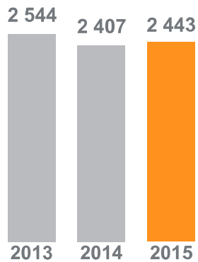
Liikevaihto (milj. e)